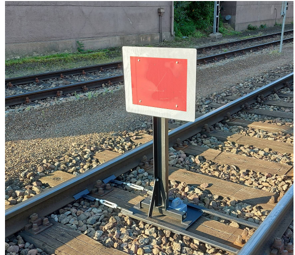
Abbildung 2: Ordnungsgemäß aufgestellte Sh-2-Tafel am Beispiel Gleis 2