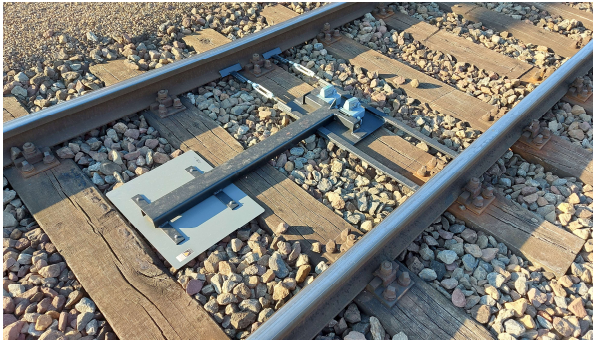
Abbildung 1: Abgeklappte Sh-2-Tafel am Beispiel Gleis 2